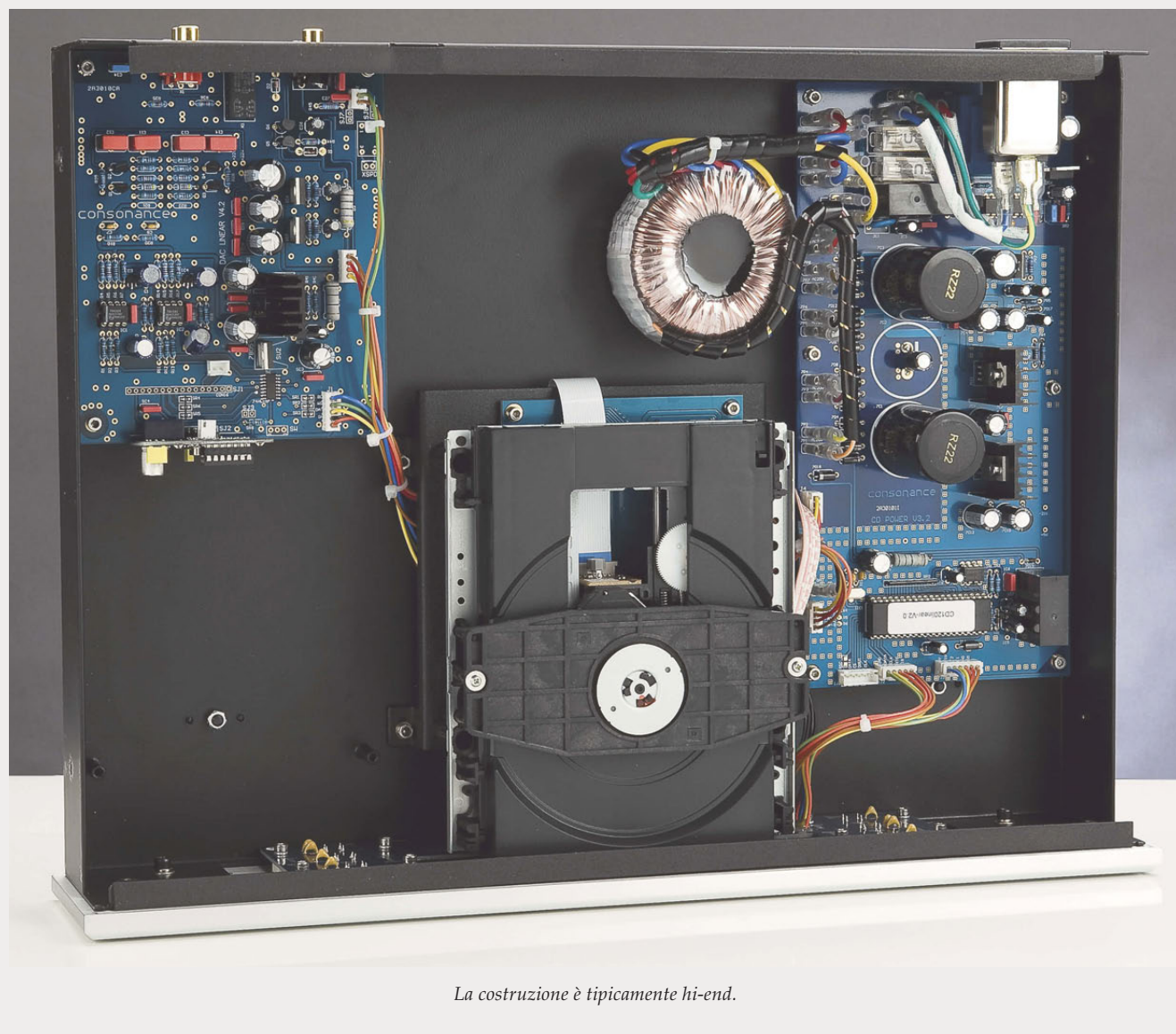
La costruzione è tipicamente hi-end.